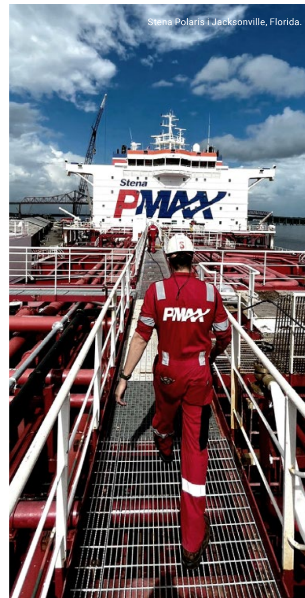
Stena Polaris i Jacksonville, Florida.