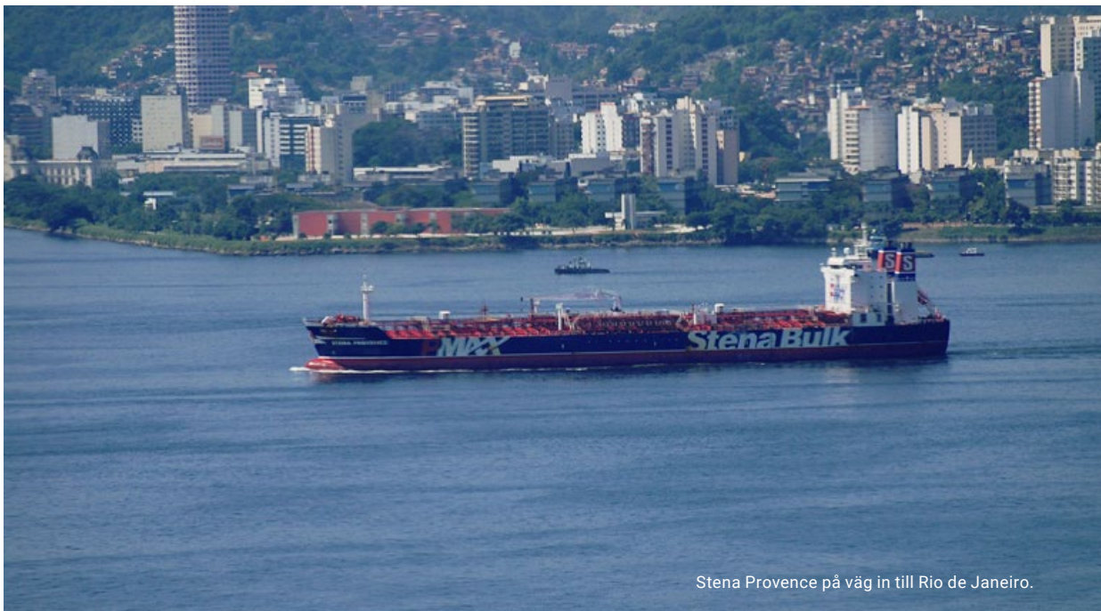
Stena Provence på väg in till Rio de Janeiro.

Under året inträffade glädjande nog ingen arbetsplatsincident som medförde att den enskilde medarbetaren var oförmögen att återgå till arbetsskiftet dagen efter (Lost Time Injury). Dock inträffade en mindre incident som medförde begränsningar